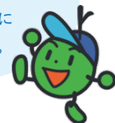
かるいフットワーク

メンバーになると「活動バッジ」と 「メンバー手帳」をプレゼント！ クラブ活動すると、手帳に スタンプが押されるよ。